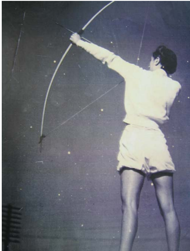
Foto 21. Arquería