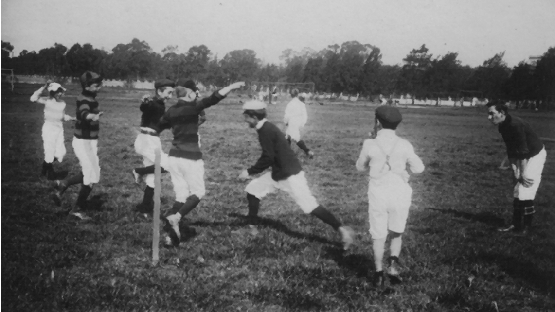
Foto 10. Juego: ejercicio de equilibrio. Sistema Argentino.