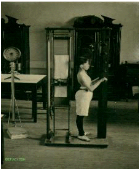
Foto 2. Mediciones del raquis. Laboratorio Escuela de Educación Física