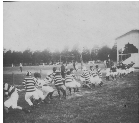
Foto 9. Ejercicio miembros superiores. Cinchada