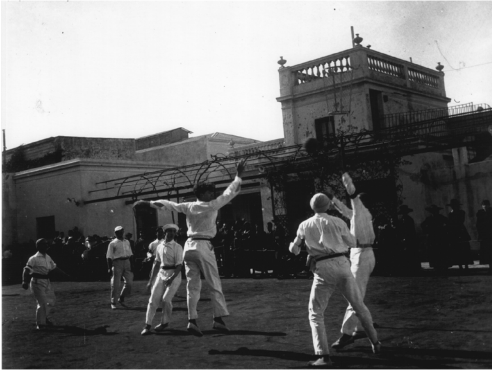
Foto 7. Ejercicio sofocante. Pelota al Cesto.