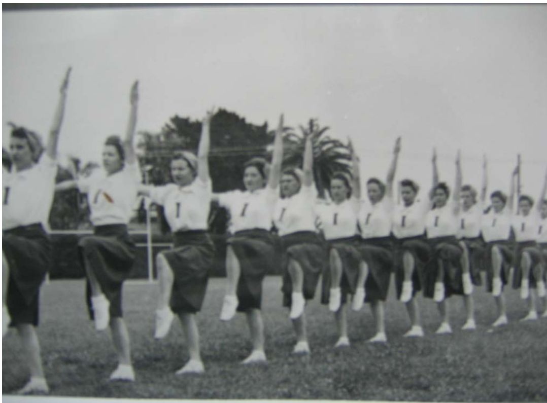
Foto 13. Gimnasia de conjunto. Fuente: Centro de Documentación Histórica. ISEF Dr. E. Romero Brest

Fuente: Argentina. Ministerio de Educación, Museo Virtual de la Gestión Educativa y Escolar, Programa Nacional de Gestión Institucional, 2001.