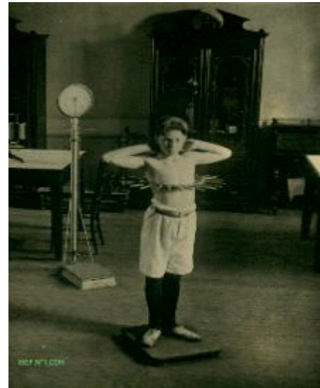
Foto 3. Mediciones del tórax. Toracómetro, Laboratorio.