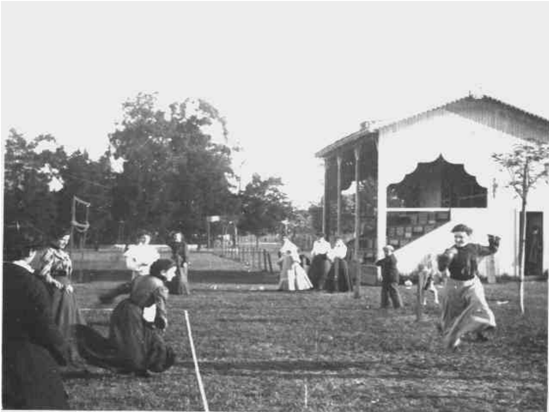
Foto 1. Actividad física mujeres en el Club Atalanta, 1902.