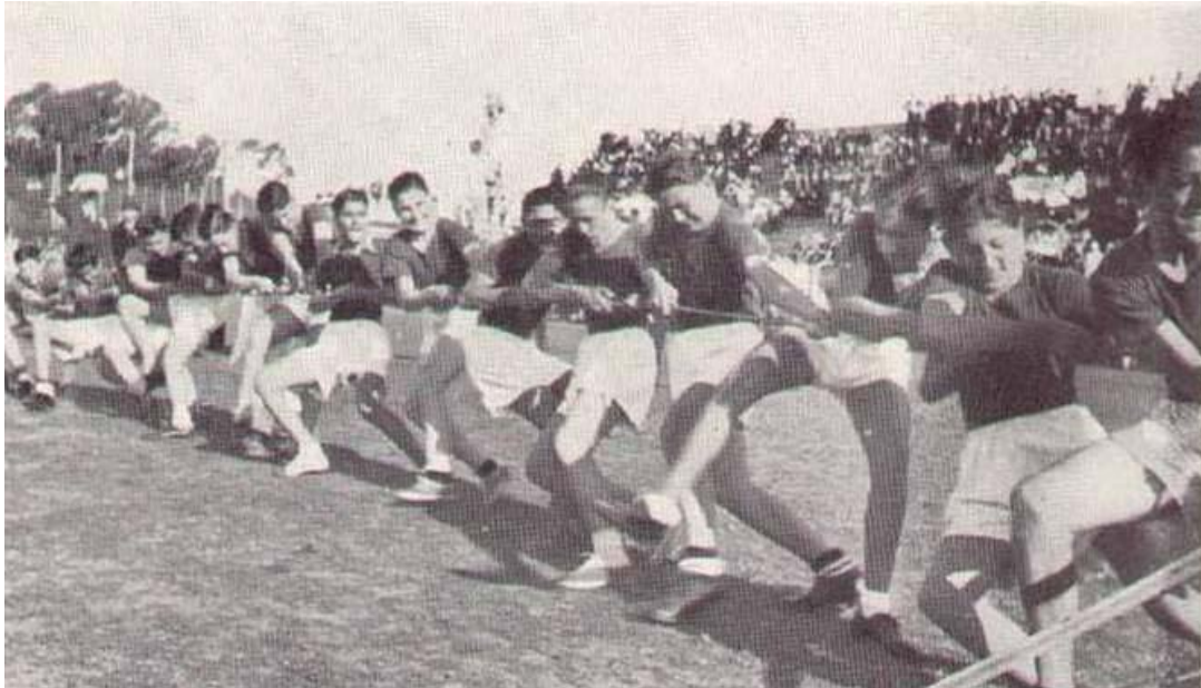
Foto 12. Juego de fuerza. Cinchada

Fuente: Argentina. Ministerio de Educación, Museo Virtual de la Gestión Educativa y Escolar, Programa Nacional de Gestión Institucional, 2001.