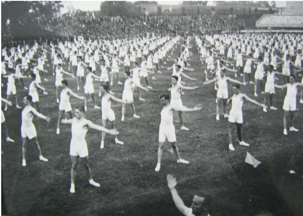
Foto 14. Gimnasia Método Único con Instructor.