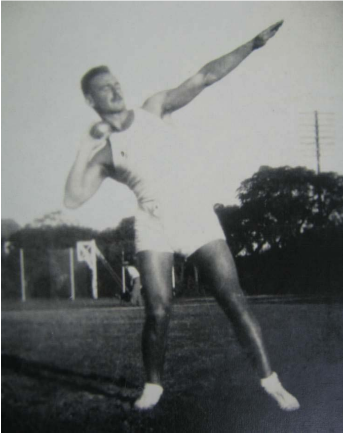
Foto 20. Atletismo. Lanzamiento bala