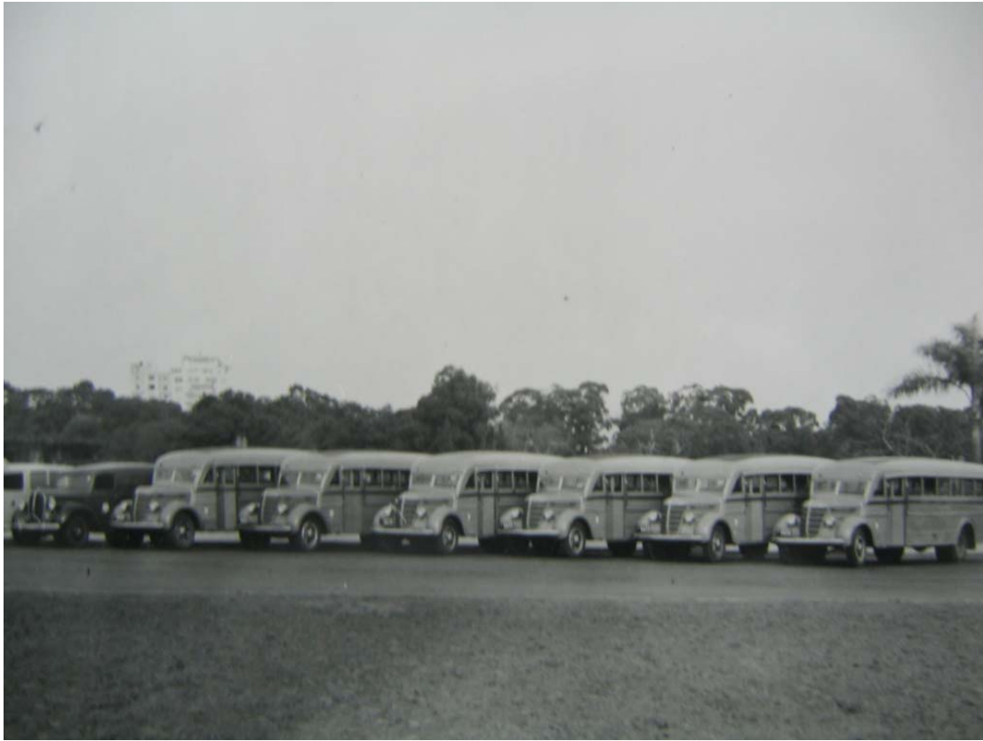
Foto 16. Transporte colectivo.