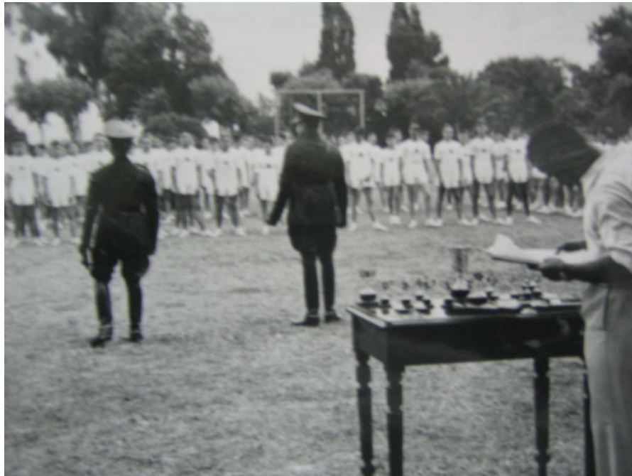
Foto 17. Militares en la entrega de premios.