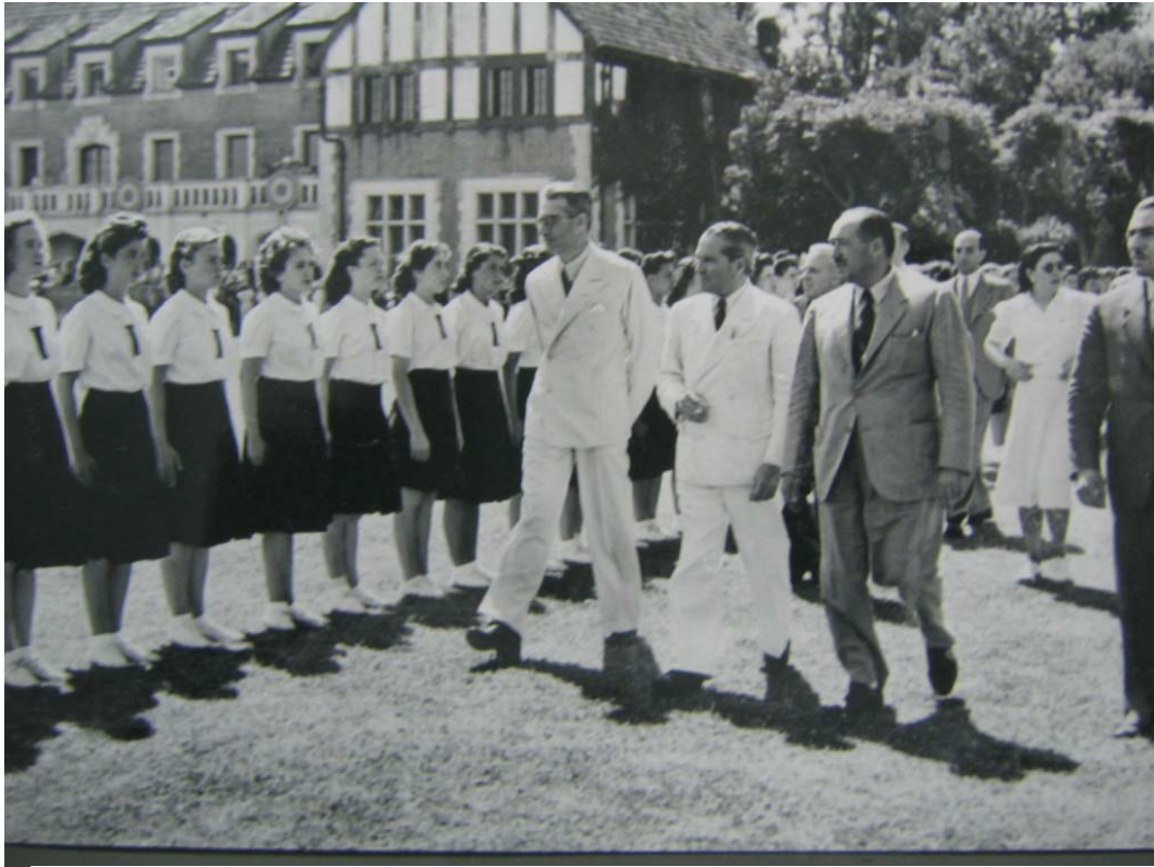
Foto 18. El Director General pasa revista en el Instituto.