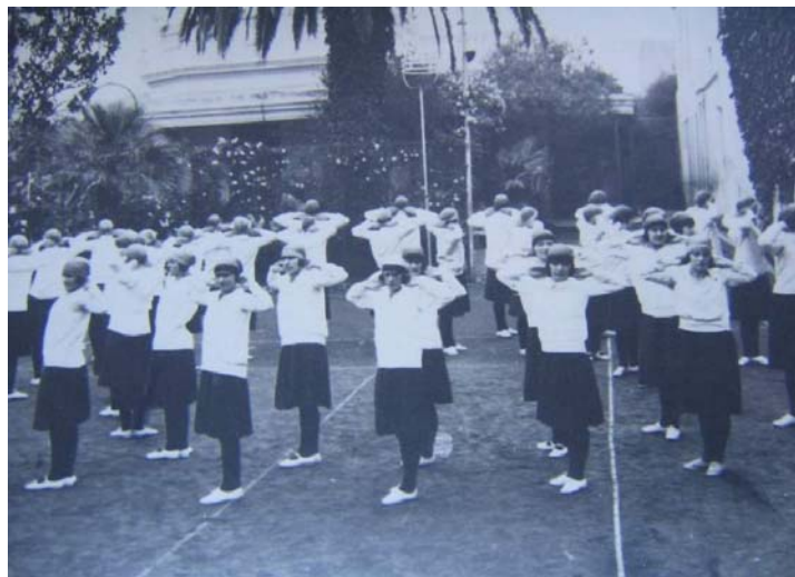
Foto 5. Gimnasia metodizada. Sistema Argentino.