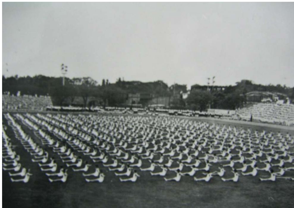
Foto 19. Exhibición varones.