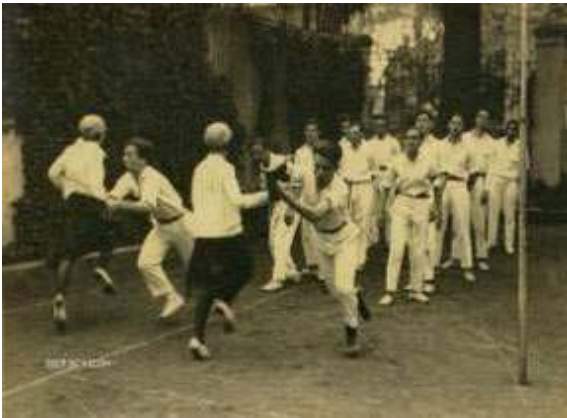
Foto 8. Ejercicios sofocante. Carrera de Banderitas

Fuente: Centro de Documentación Histórica. ISEF Dr. E. Romero Brest