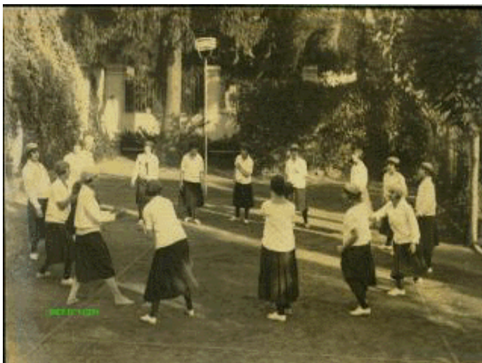
Foto 6. Ejercicio de brazos. Sistema Argentino.