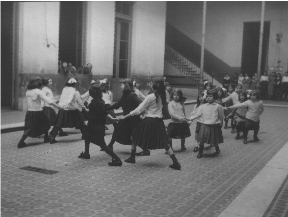
Foto 11. Rondas escolares.