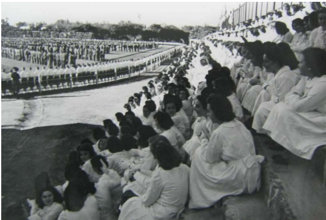
Foto 15. Exhibición en el estadio.